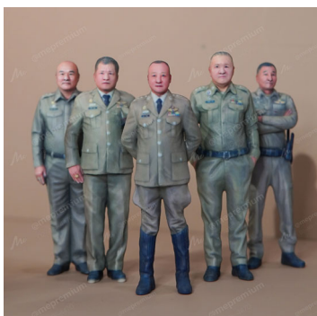
ของขวัญเกษียณอายุ