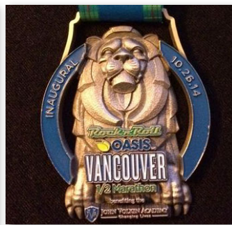
ไม่จำกัดขนาด/รูปทรง