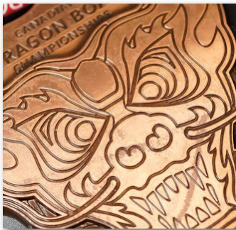
CNC ทำลวดลาย