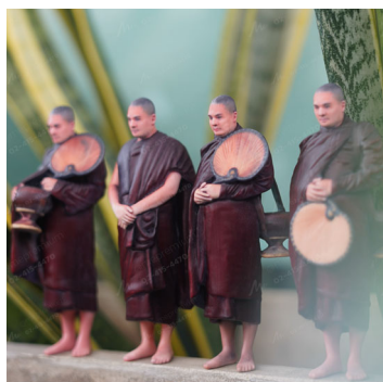
งานของพรีเมียม