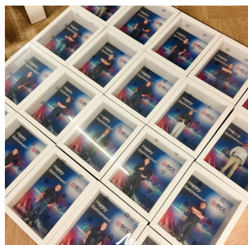
ของที่ระลึกองค์กร