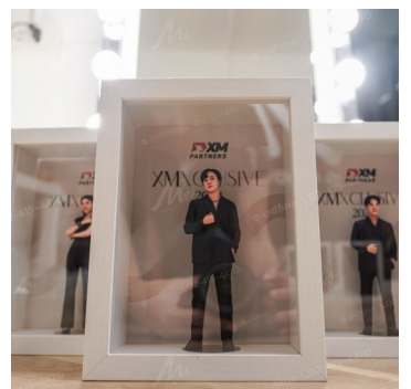
บุคคลสำคัญ