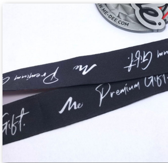
สายคล้อง