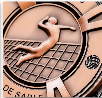
ทำนูนขึ้น