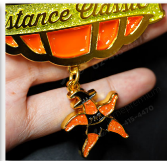
เพิ่มอะไหล่พิเศษ